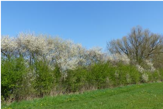
Een houtwal.

Veel heggen en houtwallen zijn uit het Sallandse landschap verdwenen. En dat is zonde. Want niet alleen zijn deze heggen en houtwallen een lust voor het oog, veel vogels en andere dieren vinden er een schuilplek en voedsel. Een van de initiatieven van PvS is het weer terug planten van heggen en houtwallen.