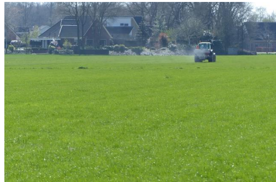
Monocultuur Engels raaigras.

Boerenland in Salland was eeuwenlang afwisselend en kleinschalig. Akkers en weiden doorsneden door greppels en omzoomd door houtwallen en hagen. Dat beeld is de laatste 50 jaar drastisch veranderd. Veel houtwallen zijn opgeruimd, kavels vergroot, greppels dichtgegooid. En de monoculturen deden hun intrede; verbouwen van één soort gewas in plaats van wisselende soorten. Zelfs de weilanden waarin kruiden en gras elkaar afwisselden zijn omgevormd tot strakke vlaktes waar nog maar één soort gras de boventoon voert. En gewassen worden beschermd door een keur aan gifstoffen tegen onkruiden en insecten. Het ziet er groen uit, maar er leeft nog maar een beperkt aantal soorten planten en dieren. Sommige mensen spreken al van een 'groene woestijn'.