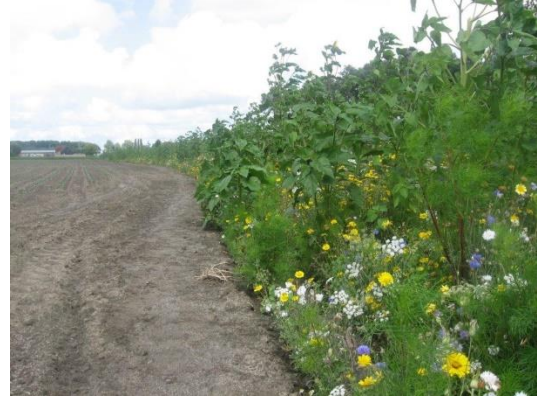
PvS betaalt zaaigoed

financiële middelen reiken. En eerst op plekken waar patrijzen zitten.