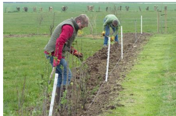
In 2015 is 390 m heg gepoot.

Stel: uw perceel ligt in een gebied waar patrijzen zitten. En u wilt de patrijs helpen met de aanplant van een heg of houtwal. PvS kan dan helpen. Wij bekostigen het plantgoed en planten ook aan. Voor zover we hiervoor nog geld in kas hebben!