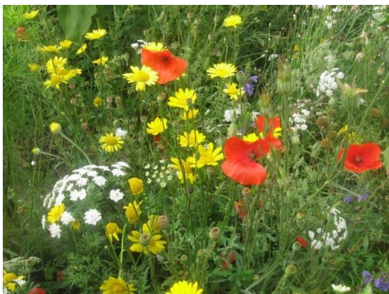
Kruidenranden zorgen voor voedsel en bescherming.

Om meer variatie in beplanting te krijgen, kunnen delen van akkers (bijvoorbeeld randen) ingezaaid worden met kruidenmengsels. Deze bieden de patrijs (en andere dieren) voedsel (ze eten de zaden en knoppen), beschutting en de jongen vinden er insecten.